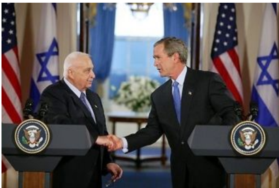
Второй зверь на службе у первого

Далее, в той же главе, я прочитал, что есть " другой зверь ... служащий первому зверю, и везде создающий царство свое, заставляющий землю и жителей ее поклоняться первому зверю, у которого смертельная рана исцелилась... и никто не сможет ни покупать, ни продавать ничего, если не будет пометен именем зверя" (Откровение 13:11-17). Затем я сделал вывод, что первый зверь - это Израиль, а второй зверь, поддерживающий его, может быть только США, которые защищают и вооружают Израиль. Я снова понял, кто эти "враги, которых я сделаю" и кто это "множество народов, наций, языков и царей, против которых я должен был снова пророчествовать", поскольку свидетельство против Израиля сегодня уже не делается так, как это делали пророки и Иисус в прошлом (см., например, Исаия 1:2-4 / Иеремия 2:26-37 / Михей 3:9-12 / Матфей 23:33-37 / Иоанн 8:44).