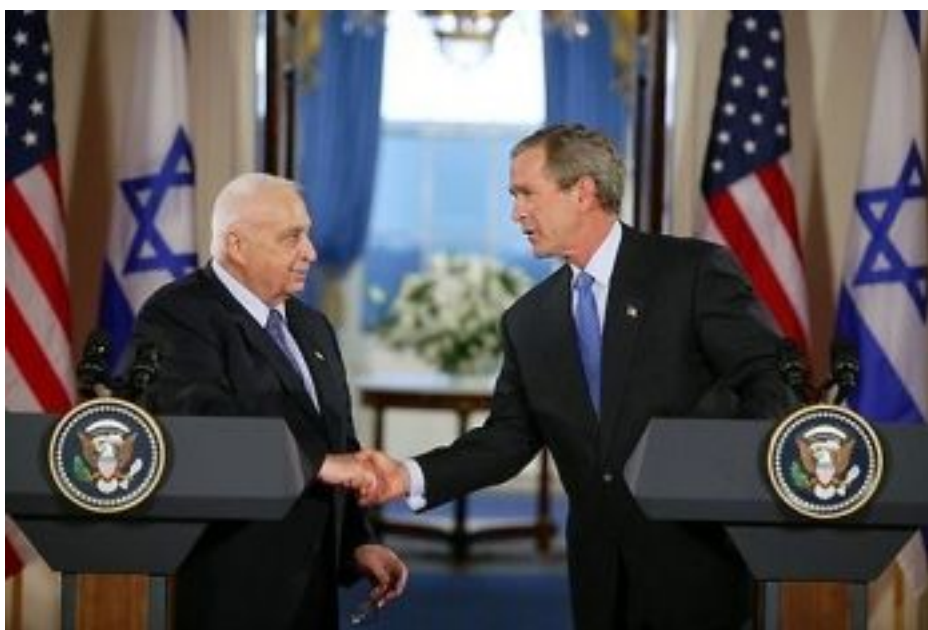
La deuxième Bête au service de la première

Plus loin, dans le même chapitre, je lus qu'il y a « une autre Bête ... au service de la première Bête, elle en établit partout l'empire, amenant la terre et ses habitants à adorer la première Bête dont la plaie mortelle fut guérie... et nul ne pourra rien acheter ni vendre s'il n'est marqué au nom de la Bête» (Apocalypse 13,11-17). Je déduisis alors que la première Bête étant Israël, la deuxième Bête qui la soutient ne peut être que les U.S.A qui protègent et arment Israël. Je compris encore qui sont ces «ennemis que je m'attirerais» et qui est la «foule de peuples, de nations, de langues et de rois contre qui il me fallait de nouveau prophétiser», puisque le témoignage contre Israël ne se fait plus aujourd'hui comme les Prophètes et Jésus le faisaient autrefois (voir par exemple Isaïe 1,2-4 / Jérémie 2,26-37 / Michée 3,9-12 / Matthieu 23,33-37 / Jean 8,44).