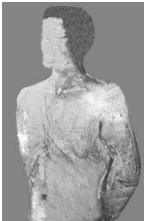
Vision de Jésus

Le 13 mai 1970, Jésus me révéla enfin le secret annoncé de la manière suivante : me réveillant à l'aube, je Le vis comme un homme de Lumière taillé dans du marbre blanc rayonnant, se tenant au chevet de mon lit. Une paix profonde, une assurance et une puissance invincible émanaient de Lui.