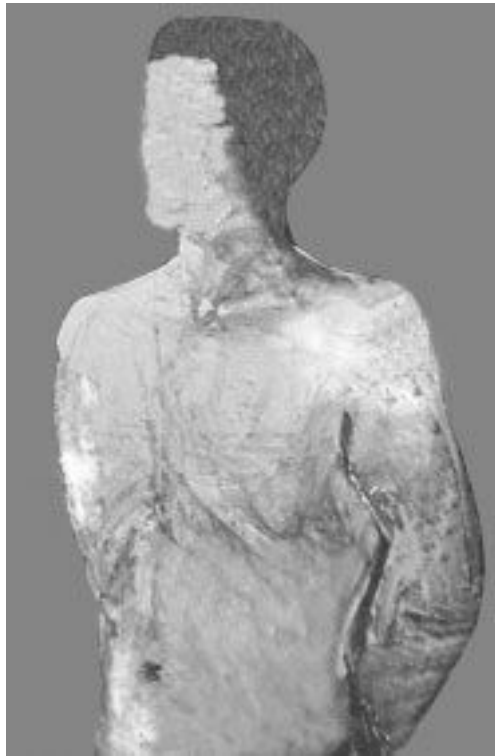
Vision von Jesus

Am 13. Mai 1970, offenbarte mir Jesus endlich in einer kurzen Vision das angekündigte Geheimnis: Als ich am frühen Morgen aufwachte sah ich einen Mann aus Licht behauen in weissem strahlendem Marmor. Er stand neben meinem Bett. Er strahlte eine tiefe Ruhe, eine Gewissheit und eine unbesiegbare Macht aus.