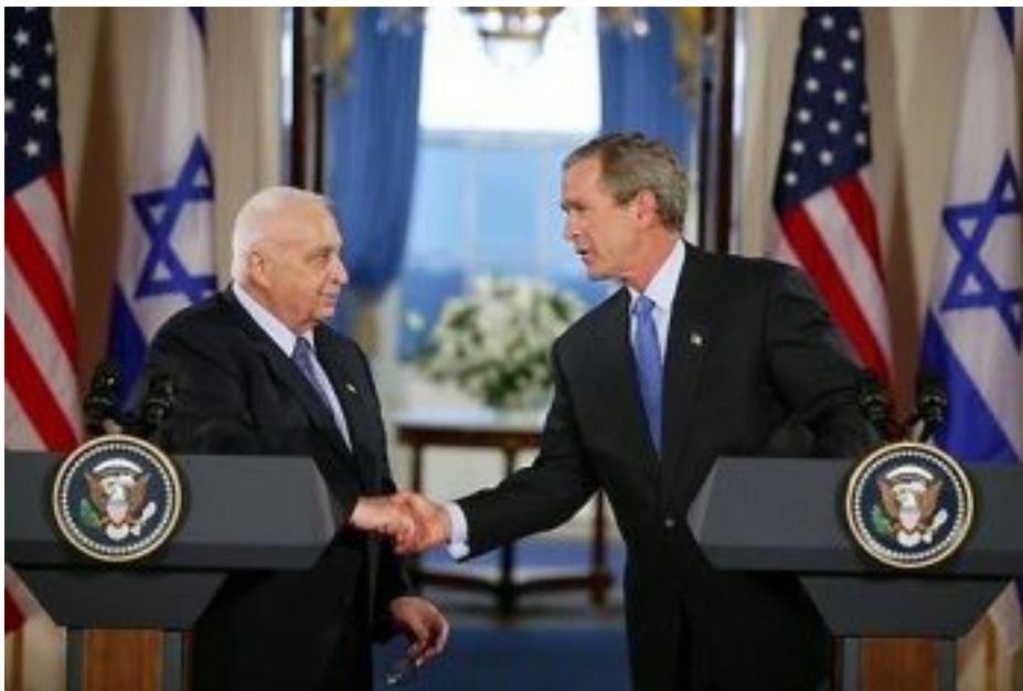
Das zweite Tier im Dienste des Ersten

Im gleiche Kapitel, weiter vorne, lass ich über „ ein anderes Tier ... im Dienste des ersten Tieres. Die ganze Macht des ersten Tieres übte es vor dessen Augen aus. Es brachte die Erde und ihre Bewohner dazu das erste Tier anzubeten, dessen tödliche Wunde geheilt war... Kaufen oder verkaufen konnte nur, wer das Kennzeichen des Tieres trug“ (Offenbarung 13,11-17). Damit ergab sich folgende Schlussfolgerung: Wenn Israel das erste Tier ist, dann kann das zweite Tier nur Amerika, das Israel schützt und bewaffnet, sein. Ich verstand welches die „Feinde“ waren, die ich mir „schaffen“ werde und wer die „vielen Völker und Nationen und Sprachen und Könige gegen die ich nochmals prophezeien musste“ sind. Denn die Prophezeiung gegen Israel wie sie die Propheten und Jesus aussprachen, ist heute verloren gegangen (siehe beispielsweise: Jesaja 1,24/ Jeremia 2,26-37 / Micha 3,9-12 / Matthäus 23,33-37 / Johannes 8,44).